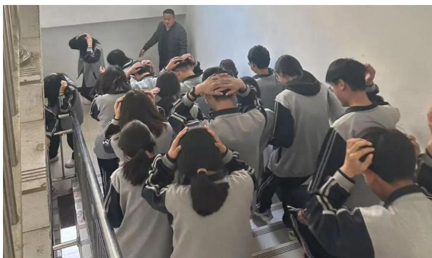
图 16 安全演练