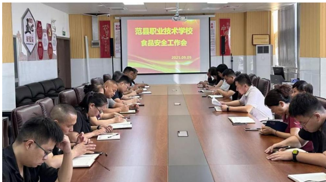
图 19 食品安全工作会

“三级联防”体系：完善“班级观察员—一年级组长—教导处”联动机制，共开展心理健康班会 4 场，组织学生心理健康测试 2 次，受理学生求助 6 起，均通过心理疏导、家校沟通妥善解决。重点人群关爱：对 8 名曾涉及冲突的学生进行一对一跟踪辅导，联合班主任制定个性化干预方案，未发生重复欺凌事件。食品安全关系到广大师生的身体健康和生命安全，是学校安全工作的重中之重，学校严格落实校长负责制，召开食品安全专题会议，将食品安全纳入学校安全工作的重要内容。配备食品安全管理人员，制定集中用餐岗位责任制及用餐陪餐制度，要求每餐由校领导进班级与学生共同用餐，及时发现并解决存在的问题，积极做好相关陪餐记录，切实把好用餐第一关，确保师生用餐安全。