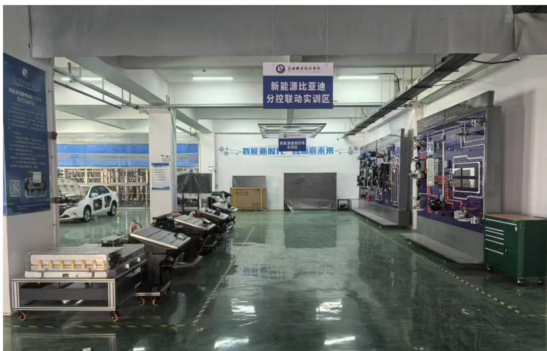
图 4 新能源实训室