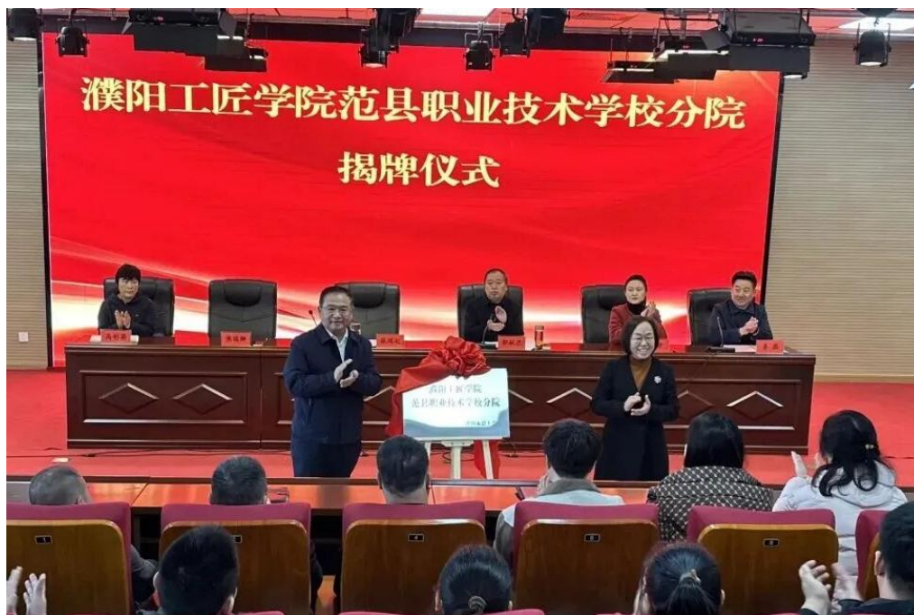
图 12 濮阳工匠学院范县职业技术学院分院揭牌仪式

工文〔2025〕62号）文件精神，2025年11月，濮阳工匠学院范县职业技术学院分院成功举行揭牌仪式。以此为契机，积极邀请了10余名各级劳模工匠代表走进课堂、言传身教，并大力推行“引企入教”“订单培养”，实现“教学”与“生产”的无缝对接，让学生所学即所用，毕业即上岗。针对全县广大职工，开展了技能培训、等级认定和技术研修。组建由劳模工匠、专业教师、企业工程师共同参与的技术服务团队。针对企业发展中遇到的技术难题，开展联合攻关，将学校的智力优势转化为现实生产力，真正实现“教学相长、产学共赢”。