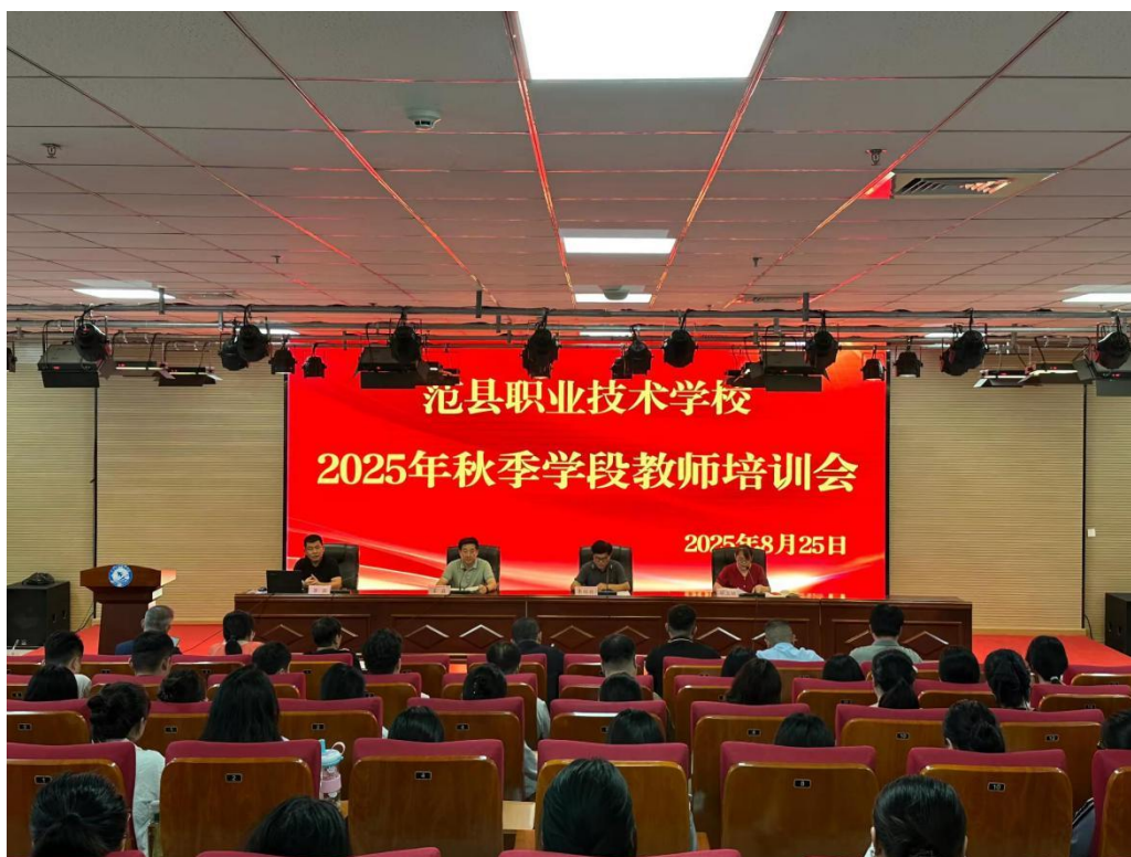
图 6 教师培训会