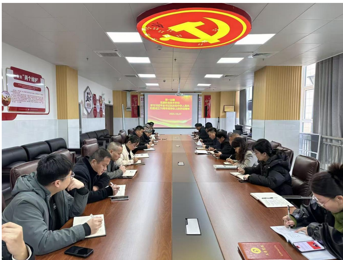
图 11 全体党员及中层干部党建学习

职工服务的理念，为被管理对象着想，营造良好的工作与学习环境，让教职工愉快地做好工作，充分发挥他们工作的积极性、主动性和创造性；开展教师“传帮带”活动，鼓励中、高级教师多带一带年轻教师。五是支持指导共青团的工作。党支部不断激发共青团的工作热情，与他们一起活动，通过各种方式鼓励他们。党支部积极支持和指导共青团的各种工作和活动，一起研讨工作计划，确定重点德育工作。