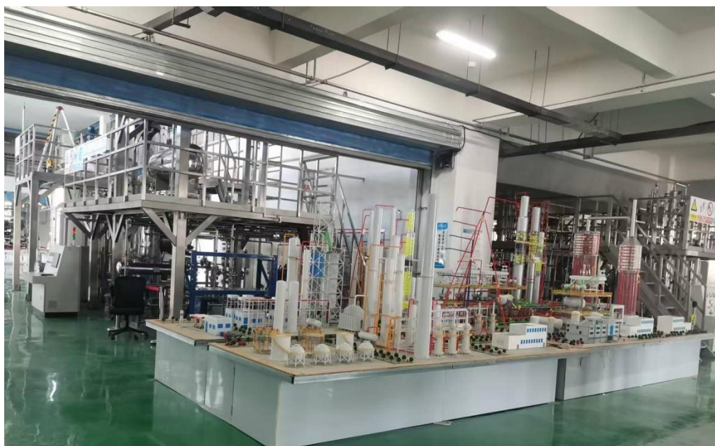
图 5 化学工艺实训室