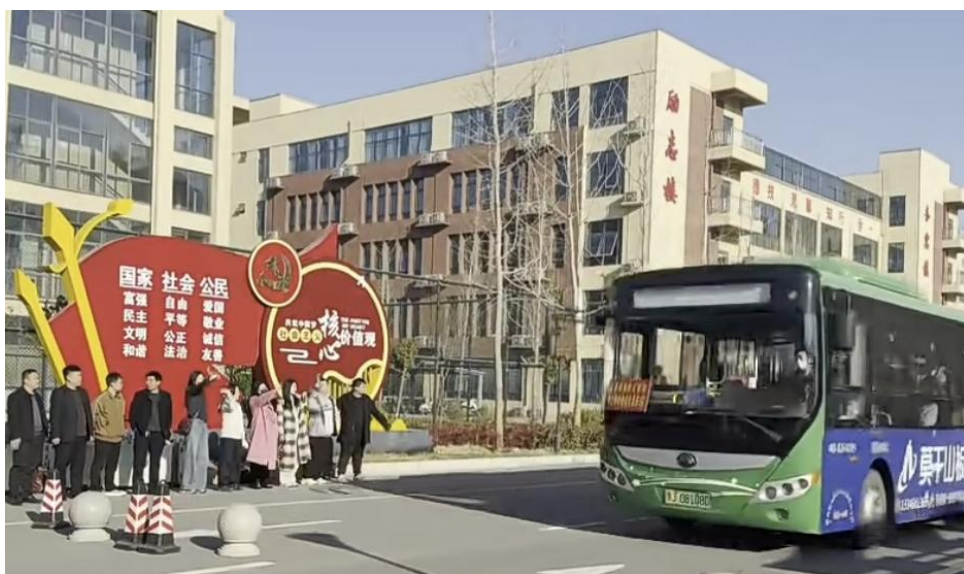
图 2 22 级学生高考