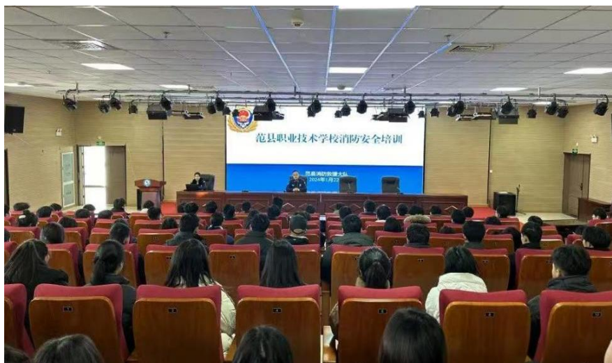
图 15 消防安全培训现场