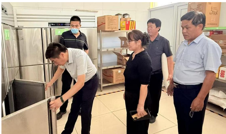
图 17 日常检查

公共区域卫生检查，重点督查通风消毒、垃圾分类及传染病防控措施，累计评选“卫生标兵班级”25班次。针对春秋季节流感高发期，加强晨午检和因病缺勤追踪，有效降低呼吸道疾病发生率。