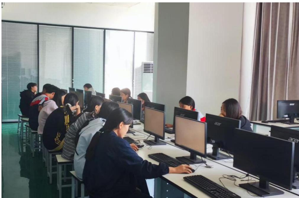
图 20 学生心理测试