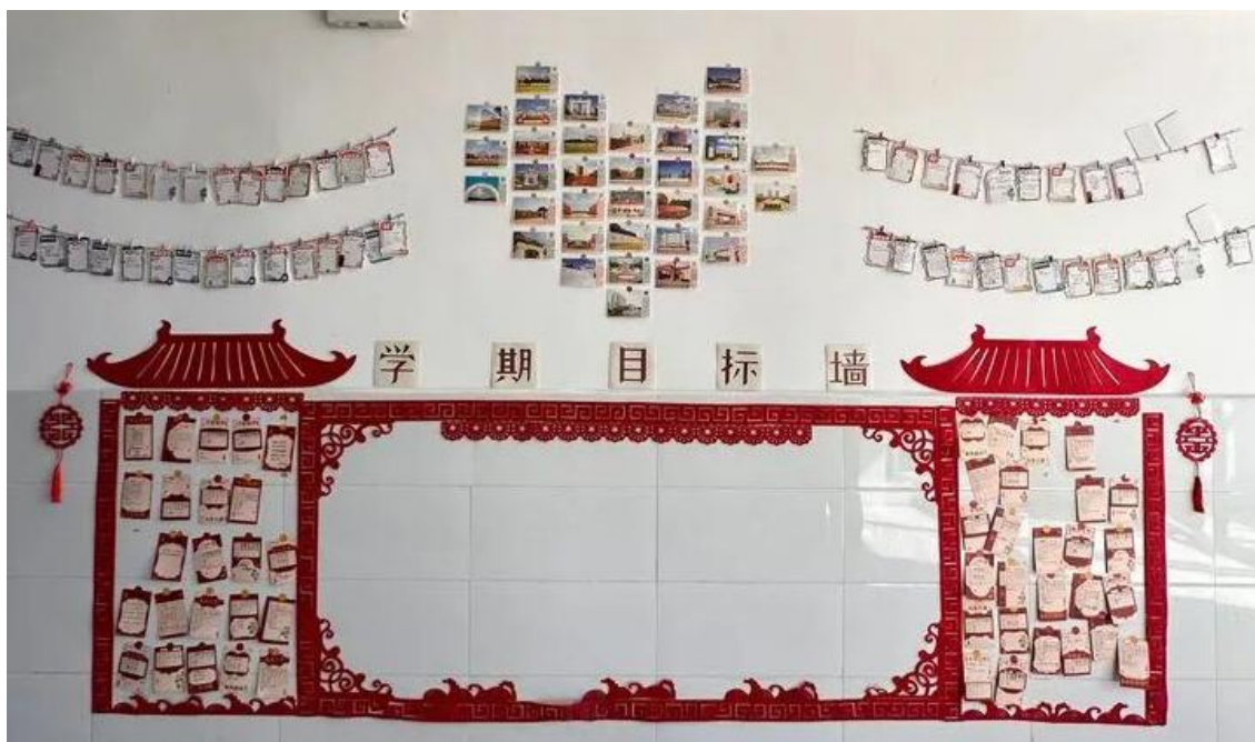
图 8 班级文化