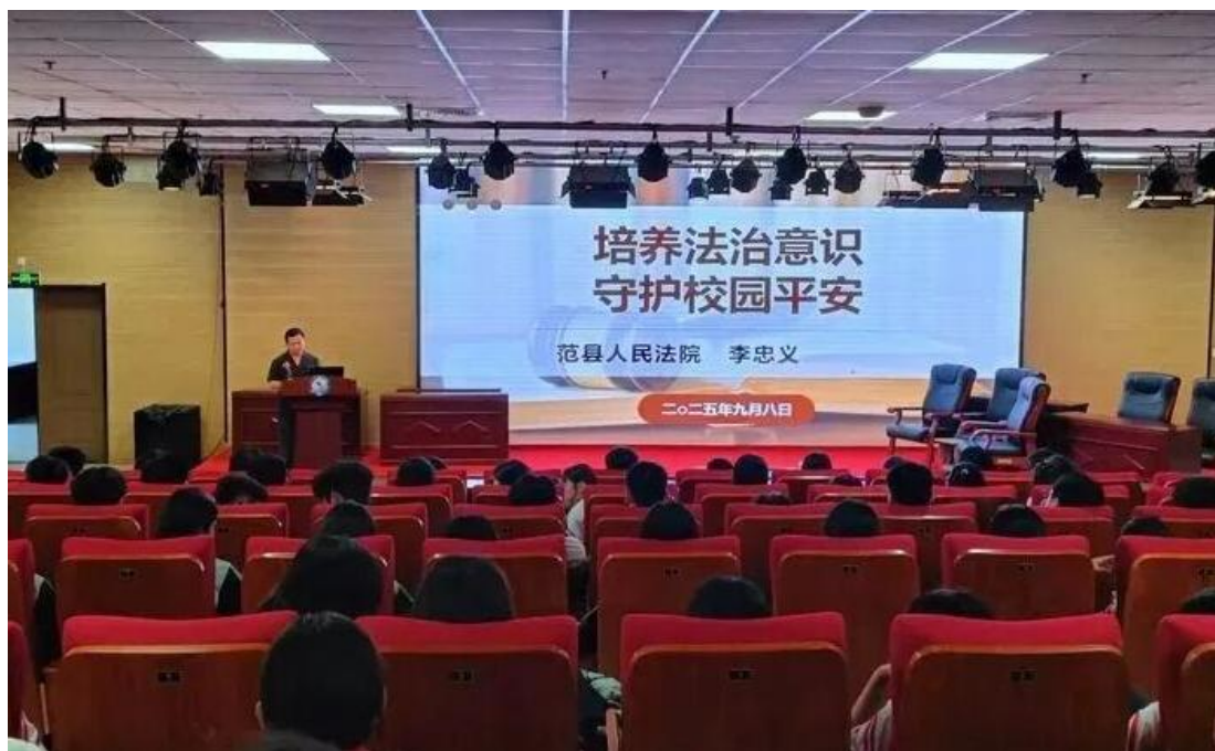
图 10 召开法治意识培训会