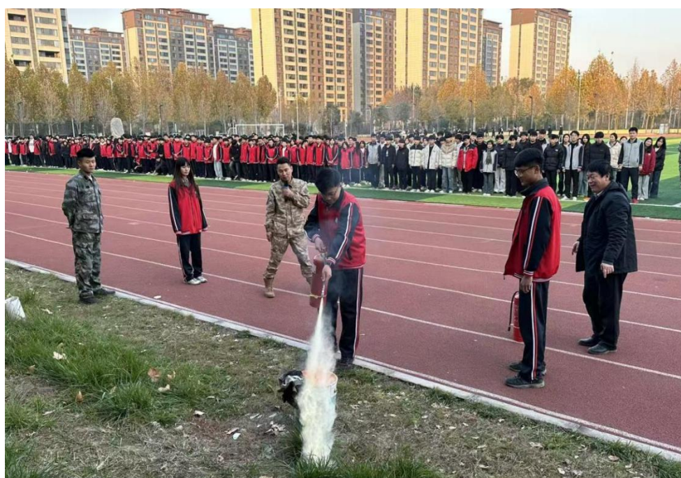
图 18 安全演练