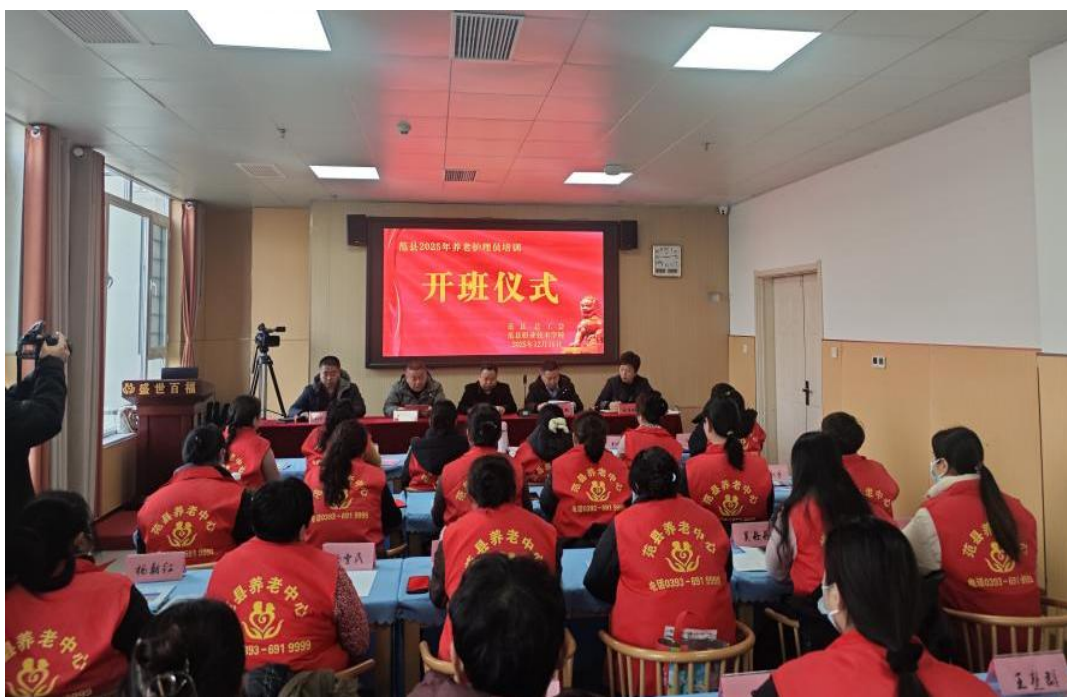
图 13 范县职业技术学校中级养老护理员职业技能提升班开班仪式

话精神，强化民营企业技能人才培养，促进民营企业又好又快发展，结合我县实际，由学校牵头，扎实推动了范县民营企业职业技能培训工作组建设和范县化工安全技能实训基地的评估，实施“技能照亮前程”培训行动，开展大规模职业技能培训，力求实现实训设备社会效益的最大化。全年累计开展各类培训七项，涵盖在职教师培训、在校生交通安全法规培训、在校生禁毒法律法规培训、保育师培训、养老护理员培训、在校生职业技能培训。对外化工工艺培训、范县化工园区产业工人安全健康素质培训。培训总人次达 2425 人次，覆盖六个职业（工种），其中养老护理员职业为重点领域技能人才培养项目。目前，已安排职业技能等级认定考试 756 人，取证 551 人。