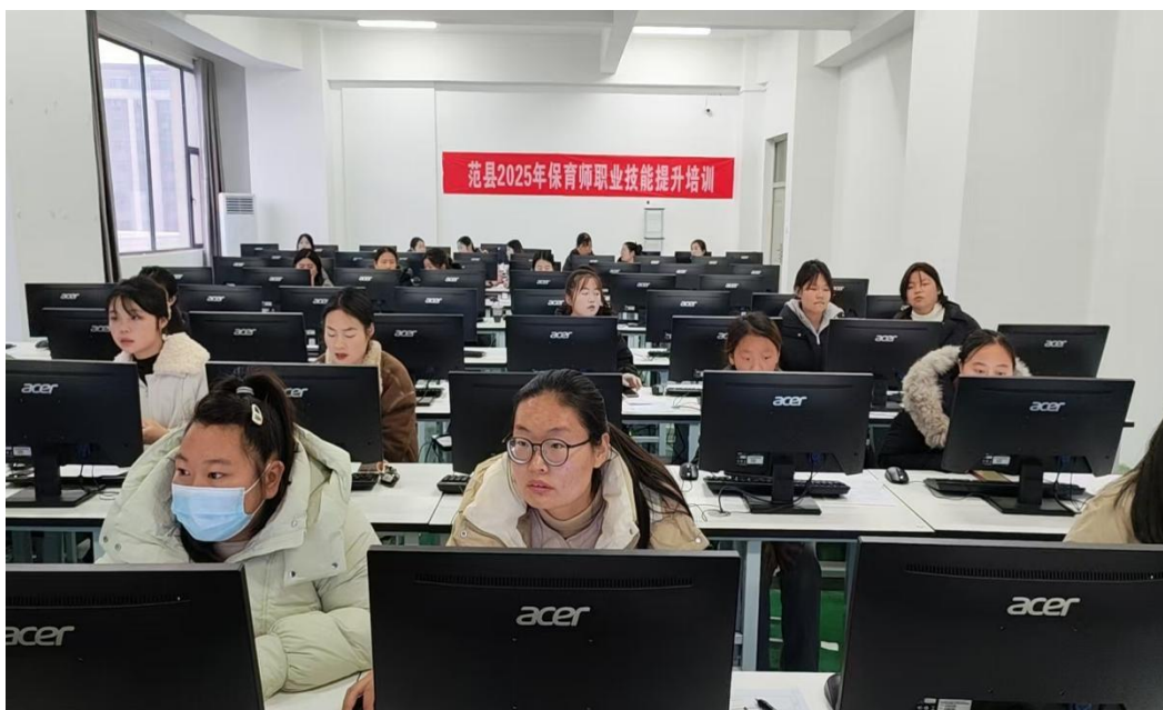
图 14 保育师培训现场