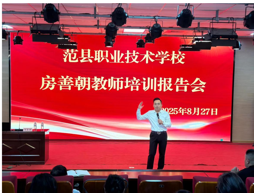
图 7 教师培训会