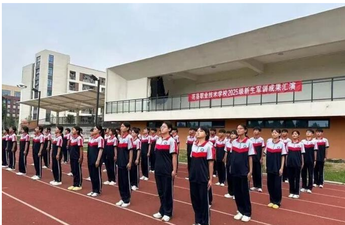
图 9 新生军训