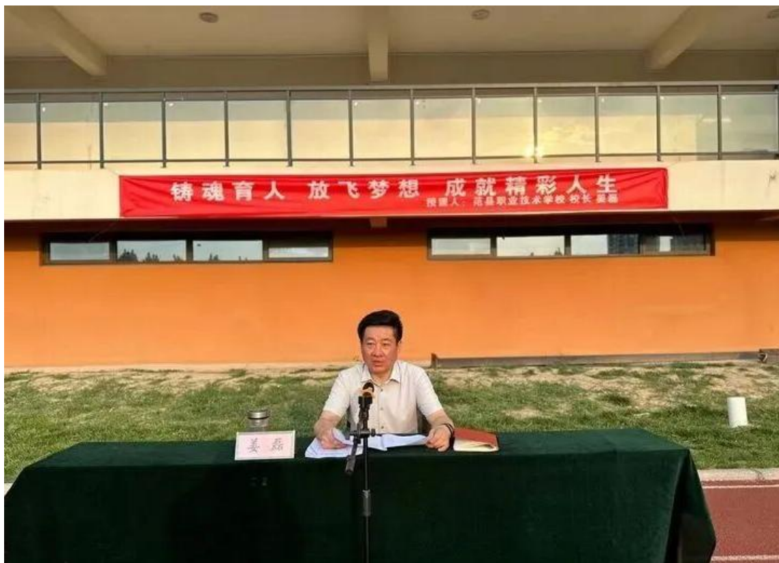
图 1 校长讲思政课

能合格率 97%;加强学生体质监控,学生体质测评合格率达 95.3%;强化学籍管理,注重学业水平监控,学生毕业率达 100%。